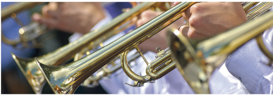
BLÄSER DER MUSIKSCHULE OBERVELLACH